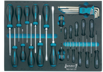
Bestell-Nr. 6309 7221